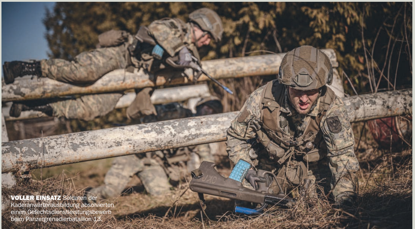
VOLLER EINSATZ Soldaten der Kaderanwärterausbildung absolvierten einen Gefechtsdienstleistungsbewerb beim Panzergrenadierbataillon 13.

Soldatinnen und Soldaten müssen von Berufs wegen fit sein. Ohne körperliche Fitness könnten Pioniertaucher, Militärpolizisten, Piloten, Panzergrenadiere oder Hochgebirgsjäger ihren Beruf nicht ausüben. Aber auch in allen anderen Einsatzbereichen sind konditionelle Fähigkeiten für eine Karriere beim Bundesheer und für die militärische Landesverteidigung von entscheidender Bedeutung.